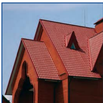
Внешний вид кровли