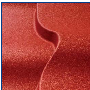
Внешний вид покрытия